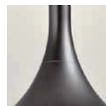
NI nickel opaco / matt nickel