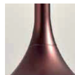
BR bronzo opaco / matt bronze