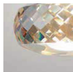
AM ambra / amber