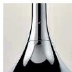
CR cromo / chrome