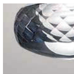
GR grigio / grey