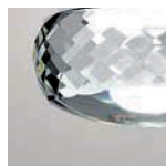
CS cristallo / crystal